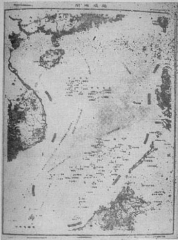
Bản đồ của Trung Quốc in năm 1973 trong tập « Bản đồ Cộng hòa nhân dân Trung Hoa ». Bản đồ này vẽ đường biên giới Trung Quốc ở vùng biển phía nam, chạy dọc bờ biển Việt Nam, vùng Bắc Ca-li-man-tan của Ma-lai-xi-a và Phi-lip-pin.