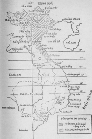
Bản đồ Đông Dương sau Hội nghị Giơ-ne-vơ năm 1954 và Đông Dương.